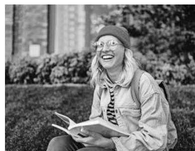
In den Osterferien veranstaltet die Hochschule Albstadt-Sigmaringen am 10. April einen Studieninformationstag.

An beiden Standorten erwartet die Gäste ein strukturierter Ablauf, um den bestmöglichen Einblick zu erhalten: Um 09:30 Uhr gibt es eine zentrale Begrüßung mit allgemeinen Informationen rund ums Studium, und im Anschluss folgt das individuelle Programm der Fakultäten mit Schnuppervorlesungen, Laborführungen und persönlichem Austausch mit Studierenden und Professor:innen.