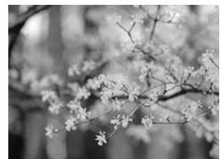
Nur ein Beispiel für viele heimische Pflanzenarten, die gut in den eigenen Garten passen: Die Kornelkirsche bietet Nahrung für Vögel und Insekten.

Einige Neophyten verbreiten sich unkontrolliert und verdrängen heimische Pflanzenarten. Dadurch geht nicht nur die biologische Vielfalt verloren, sondern es verschwinden auch wichtige Lebensräume und Futterquellen für heimische Insekten und Tiere. Denn diese sind durch das lange, eingespielte Miteinander eng an die heimische Vegetation gebunden und häufig auf diese spezialisiert. Nicht-heimische Pflanzen hingegen werden oft nicht angenommen und sind für die regionale Tierwelt wertlos.